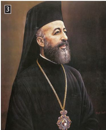
▲ Ο Αρχιεπίσκοπος Κύπρου Μακάριος Γ΄