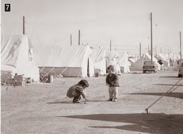
◀ Καταυλισμός προσφύγων μετά την τουρκική εισβολή