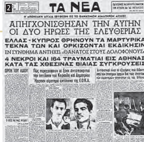
▲ Πρωτοσέλιδο της εφημερίδας Ta Nea με την αναγγελία του απαγχονισμού των Καραολή και Δημητρίου, αγωνιστών της Ε.Ο.Κ.Α.