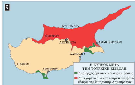
▲ Η Κύπρος μετά την τουρκική εισβολή