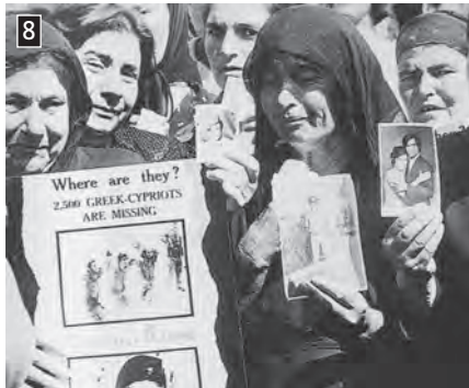
▲ Οι γυναίκες της Κύπρου σε ειρηνική διαμαρτυρία για τους αγνοούμενους της τουρκικής εισβολής