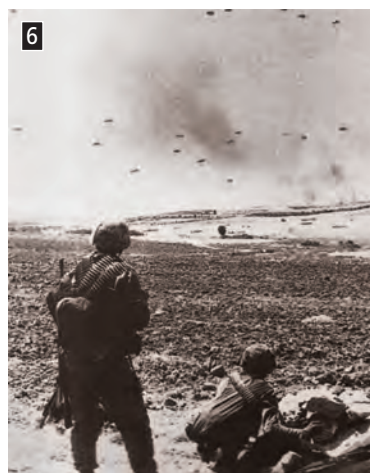
▲ Τούρκοι αξιζιπτωτιστές εισβάλλουν στην Κύπρο, φωτ. Associated Press