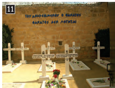
◀ Τα «Φυλακισμένα Μνήματα». Έτσι αποκαλείται το κοιμητήριο που βρίσκεται στις Κεντρικές Φυλακές Λευκωσίας. Εκεί οι Βρετανοί έθαβαν τους απαχθισμένους αγωνιστές της Ε.Ο.Κ.Α., συνολικά 13 άτομα, από τα οποία εννέα εκτελέστηκαν με απαχθισμό στις φυλακές, τρία έπεσαν στο πεδίο της μάχης και ένα πέθανε σε στρατιωτικό νοσοκομείο, μετά τον τραυματισμό του σε μάχη. Οι εννέα απαχθισθέντες, όλοι τους νέοι ηλικίας 19-24 ετών, είναι με τη σειρά που εκτελέστηκαν: Μιχαλάκης Καραολής, Ανδρέας Δημητρίου, Ιάκωβος Πατάτσος, Στέλιος Μαυρομάτης, Χαρίλαος Μιχαήλ, Μιχαήλ Κουτσόφτας, Ανδρέας Ζάκος, Ανδρέας Παναγίδης, Ευαγόρας Παλληκαρίδης. Επίσης, στα «Φυλακισμένα Μνήματα» αναπαύονται ακόμη τέσσερις αγωνιστές της Ε.Ο.Κ.Α., οι: Μάρκος Δράκος, Γρηγόρης Αυξεντίου, Στυλιανός Λένας και Κυριάκος Μάτσος.

ναί με τη σειρά που εκτελέστηκαν: Μιχαλάκης Καραολής, Ανδρέας Δημητρίου, Ιάκωβος Πατάτσος, Στέλιος Μαυρομάτης, Χαρίλαος Μιχαήλ, Μιχαήλ Κουτσόφτας, Ανδρέας Ζάκος, Ανδρέας Παναγίδης, Ευαγόρας Παλληκαρίδης. Επίσης, στα «Φυλακισμένα Μνήματα» αναπαύονται ακόμη τέσσερις αγωνιστές της Ε.Ο.Κ.Α., οι: Μάρκος Δράκος, Γρηγόρης Αυξεντίου, Στυλιανός Λένας και Κυριάκος Μάτσος.