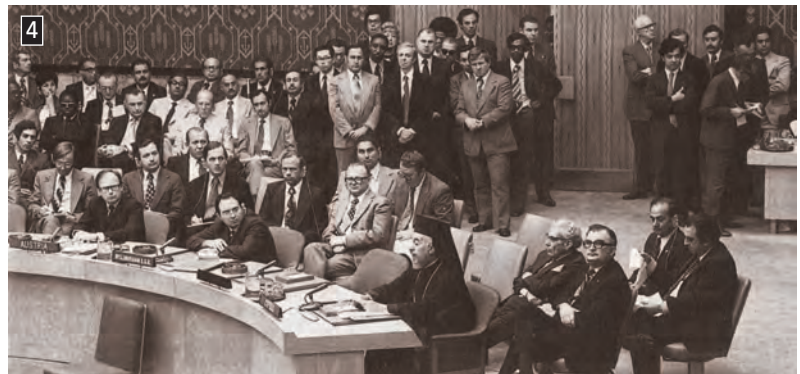
▲ Ο αρχιεπίσκοπος Μακάριος αγορεύει στα Ηνωμένα Έθνη