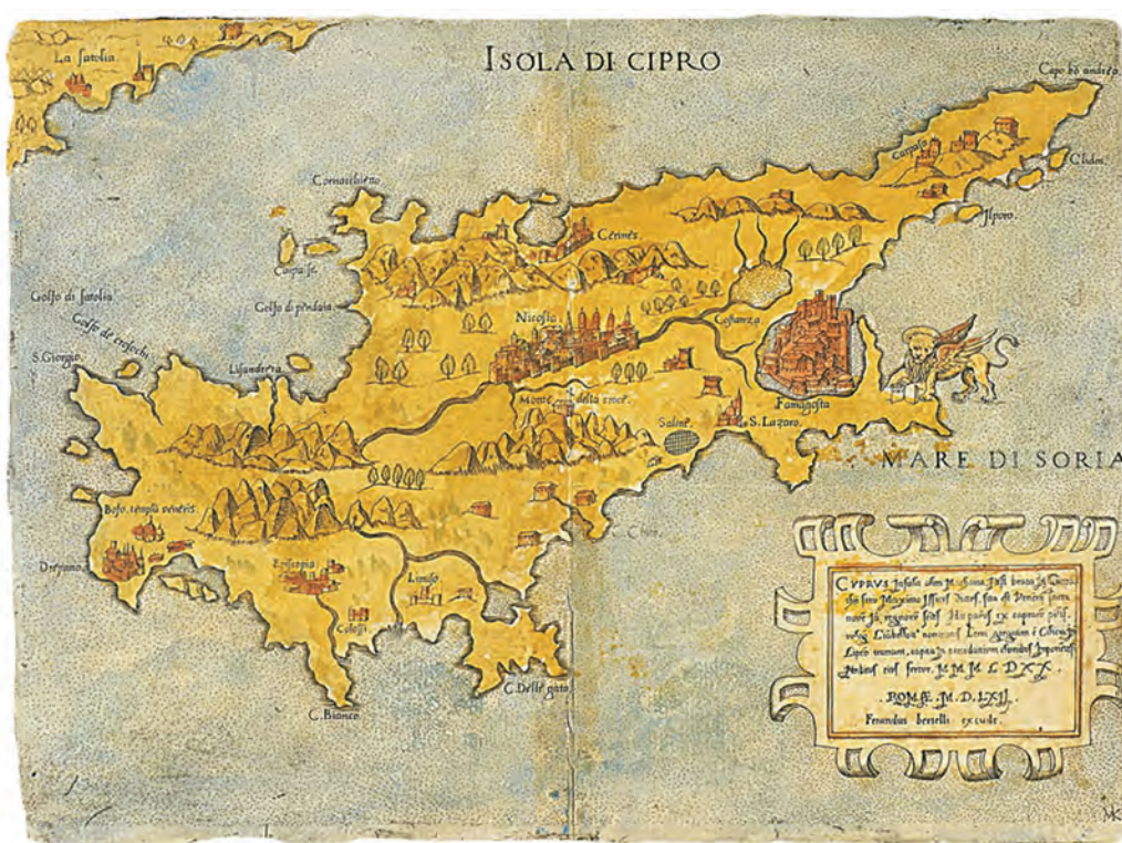
▲ Το νησί της Κύπρου σε χάρτη του 1562

Η Κύπρος απέκτησε το 1960 την ανεξαρτησία της. Το 1974, όμως, οι Τούρκοι εισέβαλαν στο νησί και κατέλαβαν ένα μεγάλο τμήμα του. Από τότε η κατοχή μεγάλου μέρους της Κύπρου συνεχίζεται.