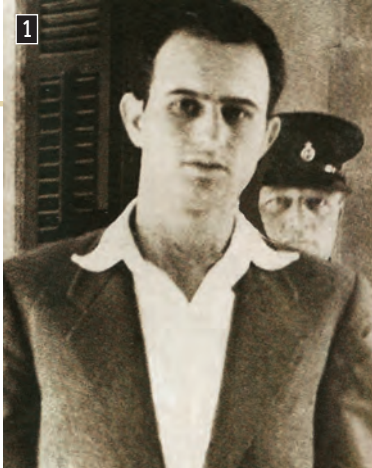
▲ Ο Μιχάλης Καραολής, ο οποίος μαζί με τον Ανδρέα Δημητρίου απαγχονίστηκε από τους Βρετανούς