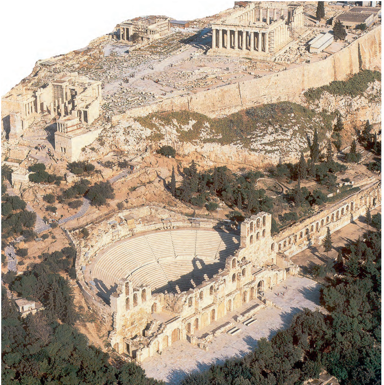
Το ρωμαϊκό Ωδείο του Ηρώδη του Αττικού, κάτω από την Ακρόπολη της αρχαίας Αθήνας.