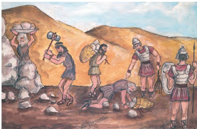
2. Αιχμάλωτοι Έλληνες δουλεύουν στους ρωμαϊκούς δρόμους.