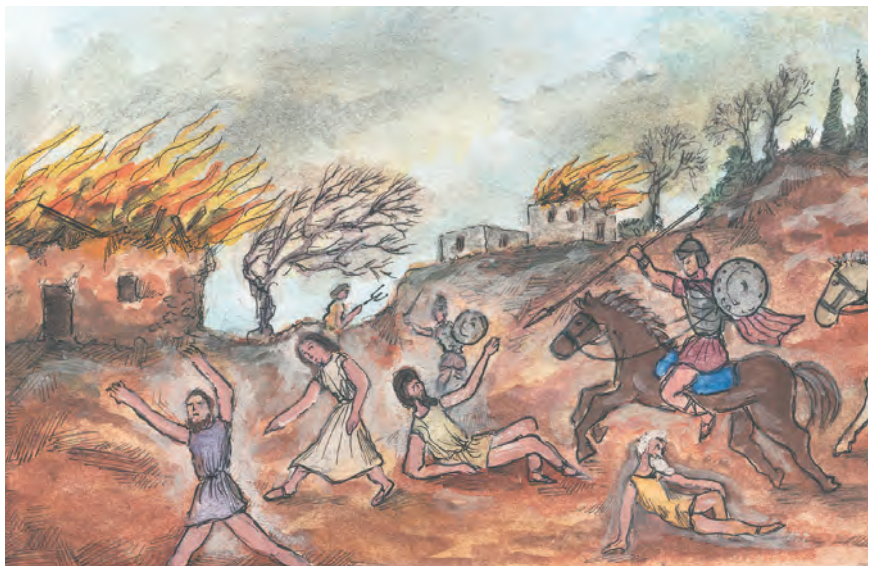
1. Οι ρωμαϊκές λεγεώνες λεηλατούσαν συχνά την ύπαιθρο.

Δυσάρεστες συνέπειες για τους Έλληνες όμως είχε και η διαρκής παρουσία ρωμαϊκού στρατού στον τόπο τους. Οι λεγεώνες τρέφονταν από τα προϊόντα της υπαίθρου και συχνά στρατολογούσαν τους κατοίκους της. Οι πληθυσμοί ένιωθαν ανασφαλείς και φοβισμένοι. Πολλοί εγκατέλειπαν τη γη τους και κατέφυγαν στις πόλεις. Κι εκεί όμως τους περίμεναν η φτώχεια, η διαρκής παρουσία και η απειλή των κατακτητών.